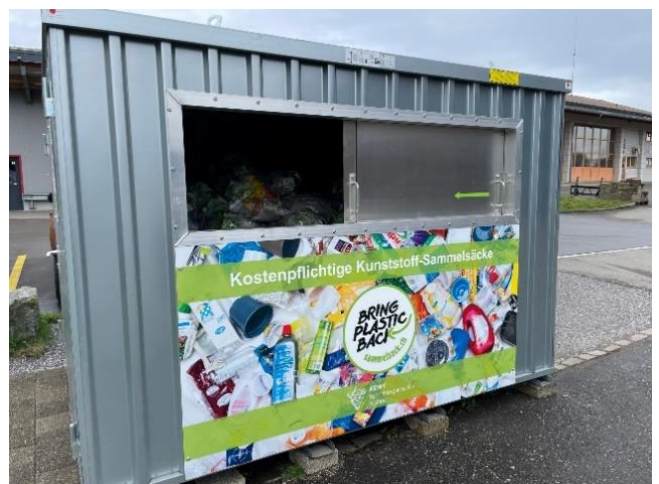
Der KEWY Sammelsack ist ab 1. Januar 2023 in verschiedenen Grössen erhältlich