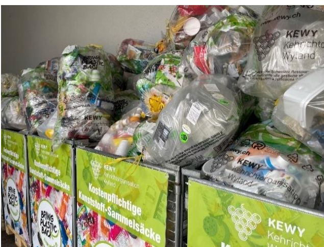
Grosse Mengen: die Sammelstellen mussten teilweise mehr als geplant geleert werden