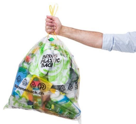
Ein zertifiziertes Sammelsystem, das sich in 500 Gemeinden etabliert hat: «Bring Plastic back»