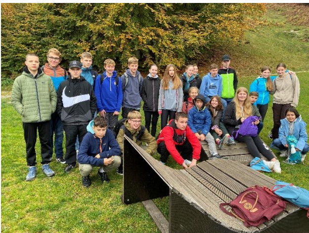
Bild: Konfirmandenlager Weinland Mitte im Tessin